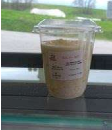
Riz au lait vanille