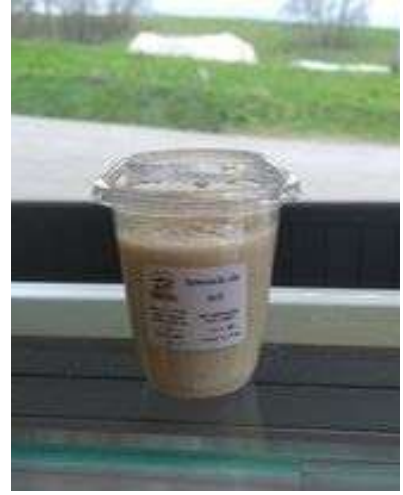
Semoule au lait vanille

Nous partageons avec vous quelques informations concernant les frelons asiatiques, car c'est la période idéale pour installer les pièges.