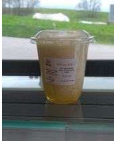
Riz au lait caramel